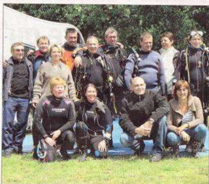
Les 16 et 17 juillet, joyeuse escapade au lac d'Eau d'Heure. Malgré la pluie, bonne humeur assurée pour les plongeurs comme les accompagnants