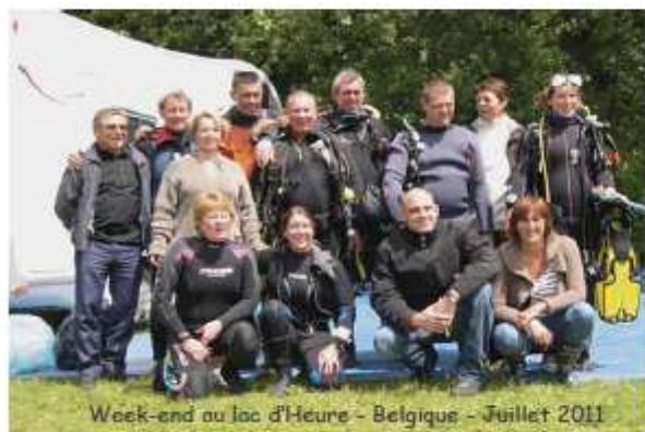
Week-end au lac d'Heure - Belgique - Juillet 2011