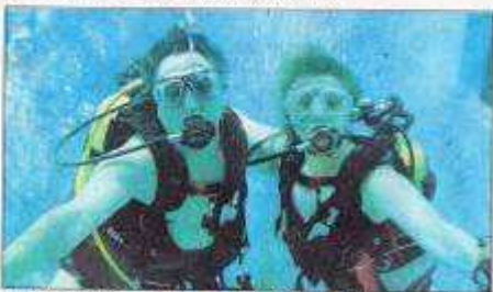
Une fosse de 33 m, une eau à 33 °C, palmiers et grottes : la piscine paradis du plongeur !