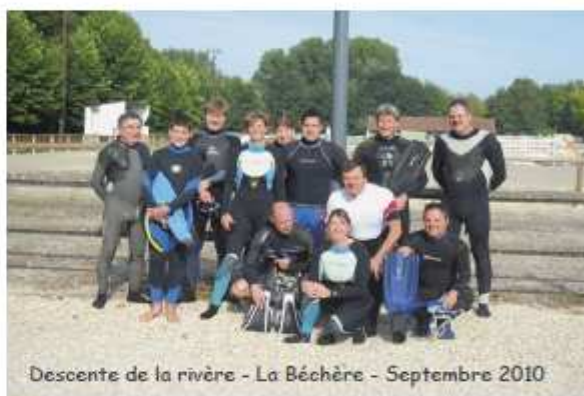
Descente de la rivière - La Béchère - Septembre 2010

http://rs10plongee.free.fr/ à bientôt par Isabelle Léaux